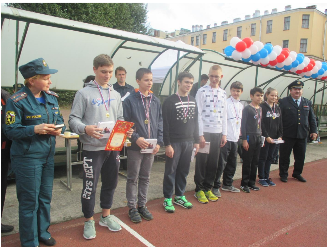
Пожарно-спасательный отряд Центрального района совместно с Отделом надзорной деятельности Центрального района 23.09.2015г.